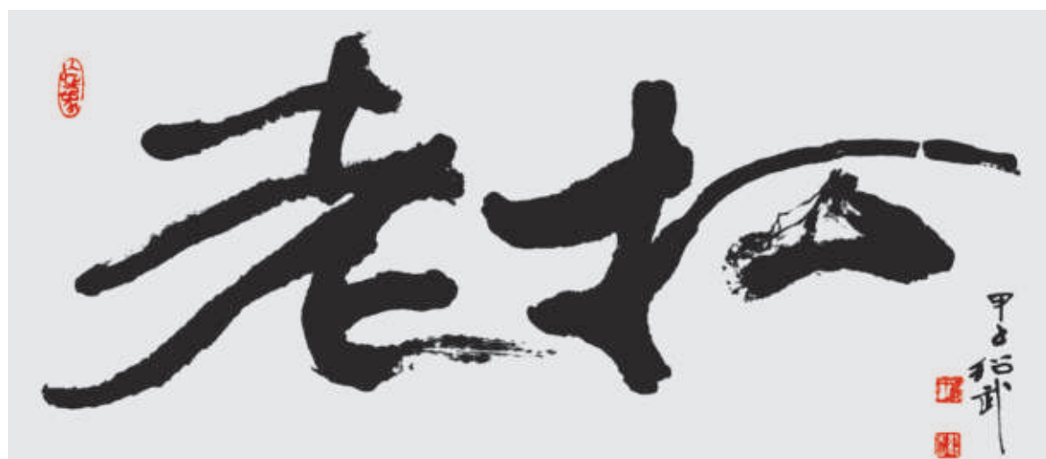
老松(四尺横批) 钱绍武