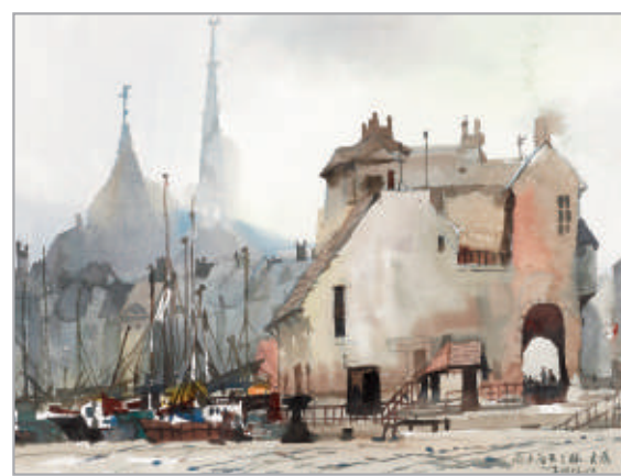
雨中翁弗兰赫(水彩) 刘大为

淋漓,形成鲜明的个人风格。他对色彩的运用、色调的把握、光影的处理、水分的渗透、笔触的率性奔放,中西交融,自成一派。